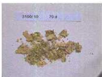
dopo 10 settimane