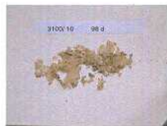
dopo 14 settimane