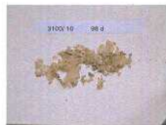
dopo 14 settimane